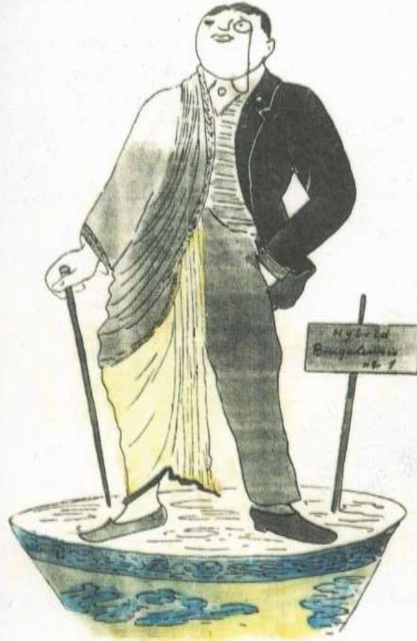
সংকরজাতের বাঙালি Hybrid Bengalesis

বিষুপবন্ধ বঙ্গদেশের প্রথম কার্টুনের বই—১৯০৬ থেকে শুরু করে ১৯১৬ পর্যন্ত বিভিন্ন ঘটনার ওপর তিনি তাঁর বুদ্ধিটি প্রয়োগ করেছেন। প্রকাশকাল ১৯১৬।